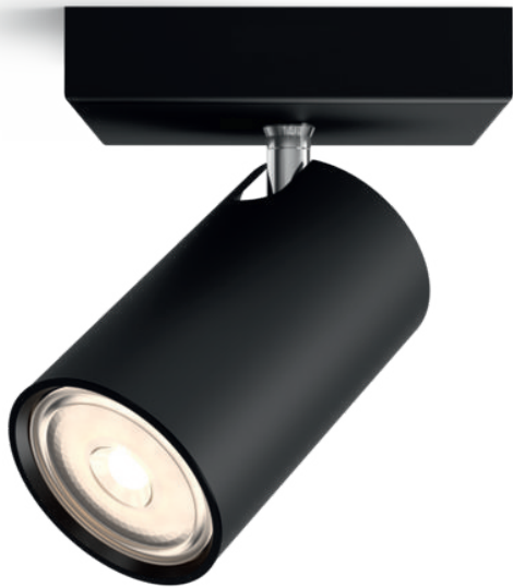
PHILIPS myLiving Spot KOSIPO Schwarz