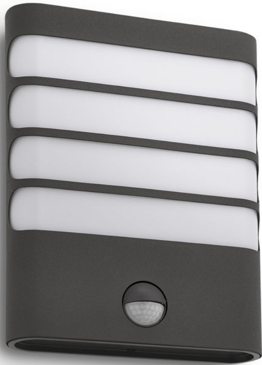
PHILIPS myGarden Wandleuchte Raccoon Anthrazit LED