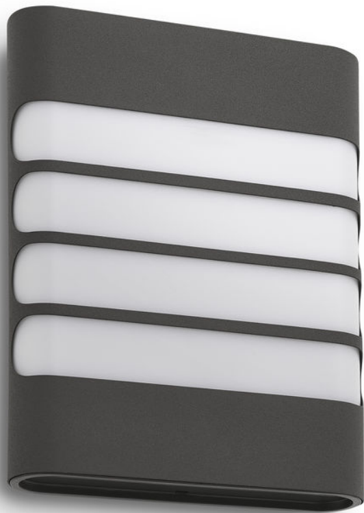
PHILIPS myGarden Wandleuchte Raccoon Anthrazit LED