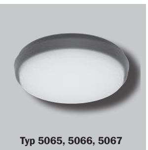
Typ 5065, 5066, 5067