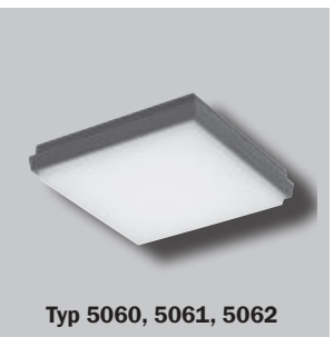
Typ 5060, 5061, 5062

Alle Leuchten haben eine Tiefe von 4,50 cm