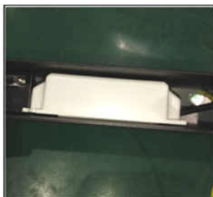
Figure4 Take out the driver