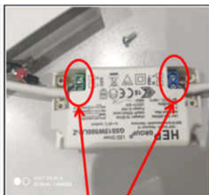
Figure6 Remove the wires