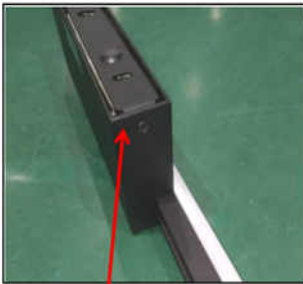
Figure 1 Remove the screws