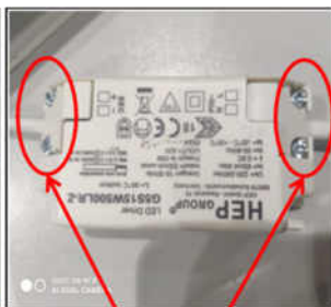
Figure5 Remove the screws