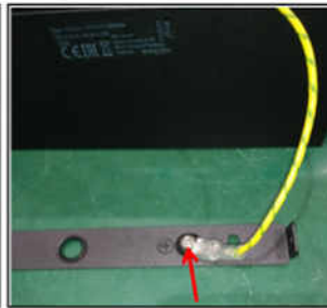
Figure 3 Remove the terminal from the plate